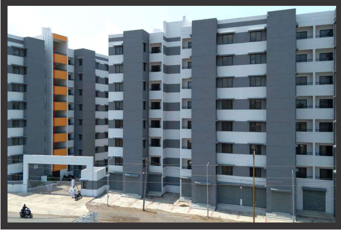
૧૩૯ એલ.આઈ.જી.-૧ + ૩૫૨ એલ.આઈ.જી.-૨ + ૬૪ એમ.આઈ.જી.-૧, જુનાગઢ