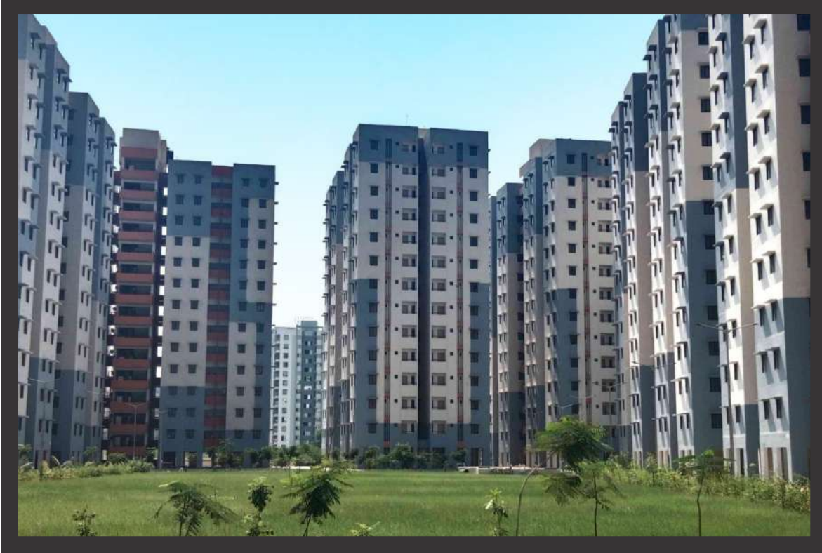
૧૫૫૨ એલ. આઈ. જી., જહાંગીરાબાદ