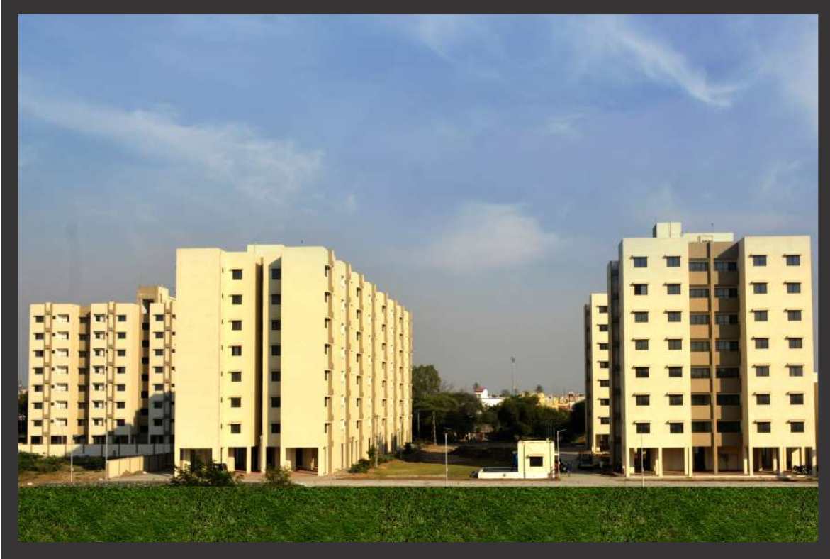
૧૬૮ એલ. આઈ. જી.-૨ + ૫૬ એમ. આઈ. જી.-૧, નવસારી