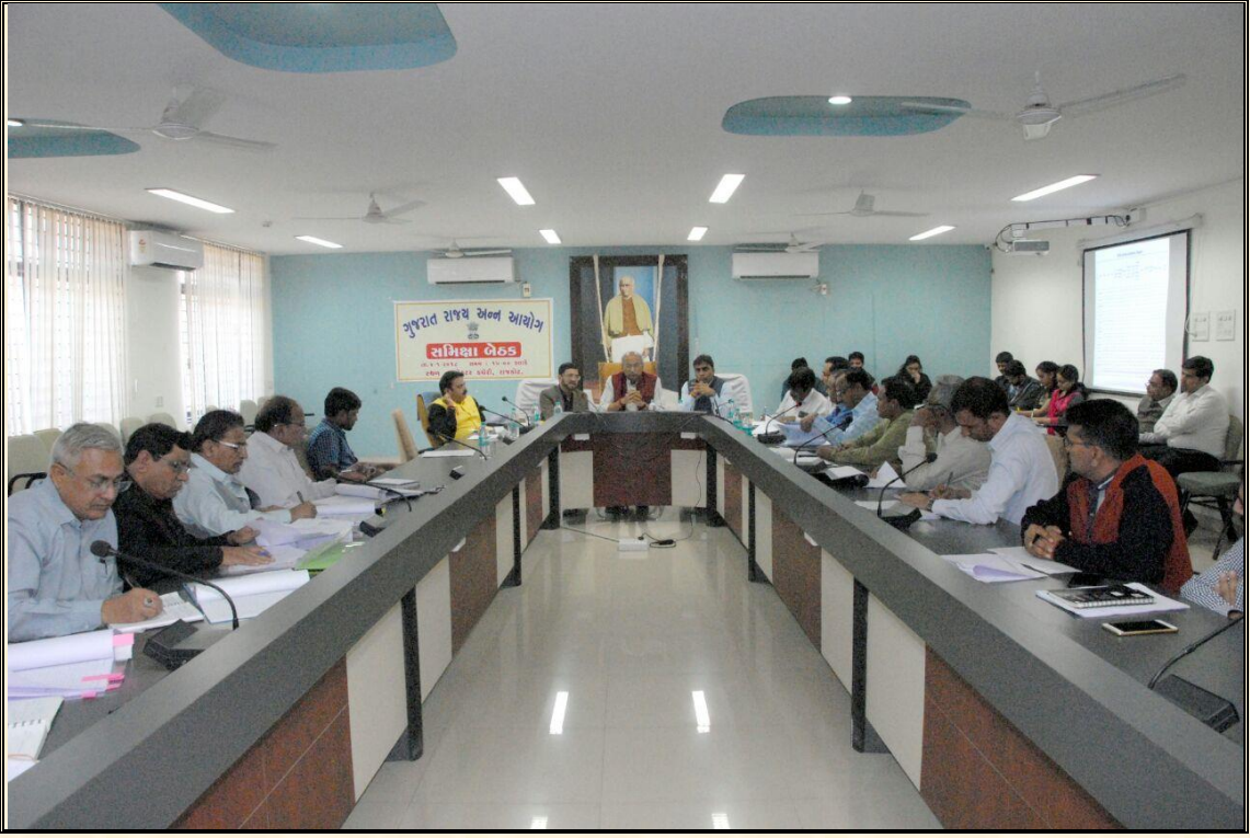
તા.૧૬/૦૧/૨૦૧૮ના રોજ સુરત જિલ્લામાં સમીક્ષા બેઠક