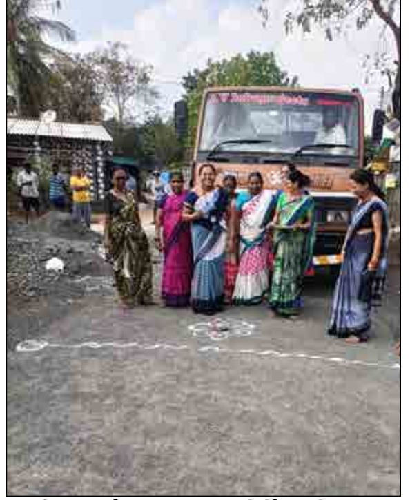
વિરાથન ખુર્દ, મહારાષ્ટ્ર ખાતે નવનિર્મિત કનેક્ટિંગ રોડ