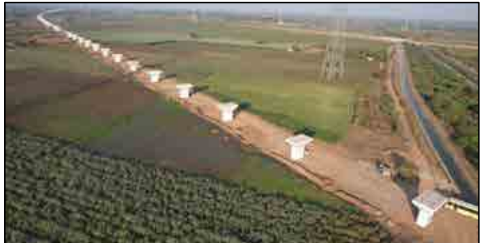
પિયર અને પિયર કેપના કામોની પૂર્ણતા, ગુજરાત