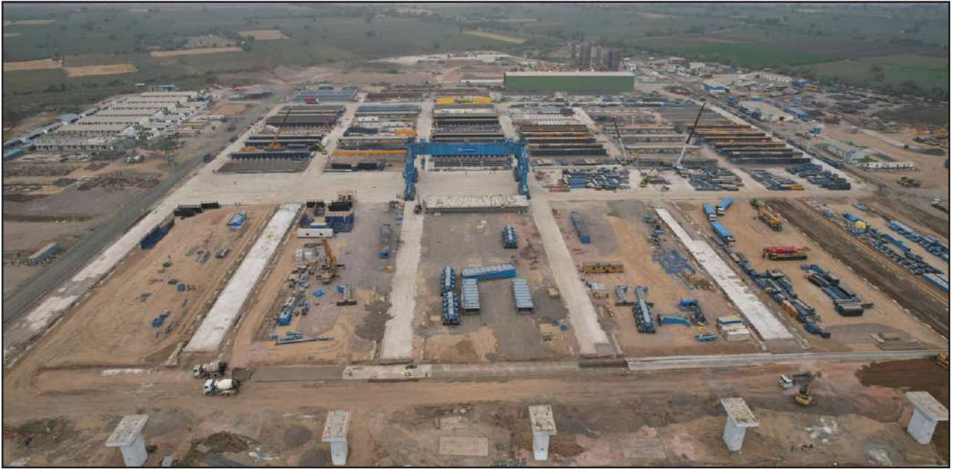
Casting yard Development work in progress, Vadodra, Gujarat