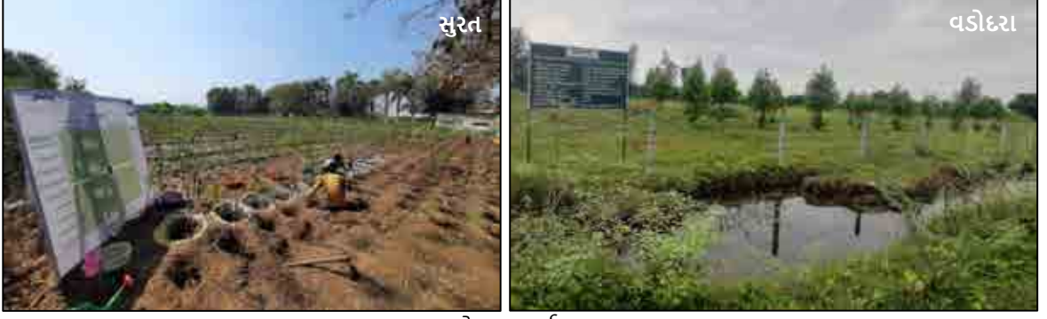
પ્લાન્ટેશન વર્ક્સ, ગુજરાત

નાણાકીય વર્ષ સમાપ્ત થયા પછી, એપ્રિલ 2022 માં તમારી કંપનીને રાષ્ટ્રીય સ્મારક પ્રાધિકરણ (NMA)/ સક્ષમ સત્તાધિકારી પાસેથી પ્રાચીન સ્મારકો અને પુરાતત્વીય સ્થળો અને અવશેષો અધિનિયમ, 1958 હેઠળ, બંનેના નિયમન કરેલ વિસ્તારમાં MAHSR પ્રોજેક્ટના બાંધકામ માટે પરવાનગી મળી છે. રક્ષિત સ્મારકો (એટલે કે સીદી બસીરનો મિનાર અને કબરો અને કાલુપુર, અમદાવાદ ખાતે ઈંટ મિનાર).