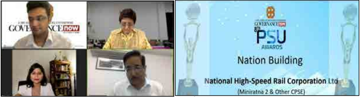
8મો PSU એવોર્ડ 2021