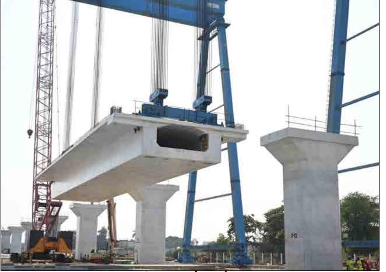
40 મીટર ક્લ સ્પાન ગર્ડરનું લોકાર્પણ, ગુજરાત