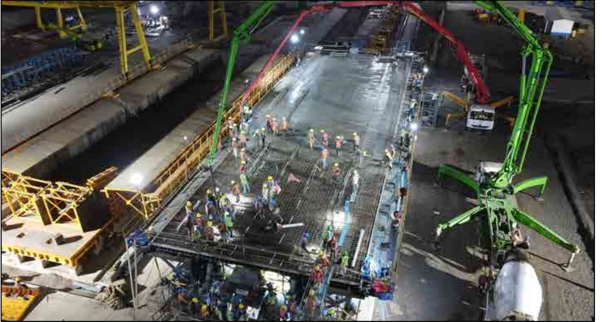
આણંદ, ગુજરાત ખાતે કુલ સ્પાન ગર્ડર કાસ્ટિંગ યાર્ડ છે

40 મીટર લંબાઈ અને 970 ટન વજન ધરાવતું પહેલું કુલ સ્પાન બોક્સ ગર્ડર ઓક્ટોબર 2021માં નાખવામાં આવ્યું છે. એક નોંધપાત્ર રીતે એક તકનીકી પ્રગતિને ચિહ્નિત કરીને, આ અત્યાધુનિક કુલ સ્પાન લોયિંગ મશીન (FSLM) નવેમ્બર 2021માં લોન્ચ કરવામાં આવ્યું છે. 31મી માર્ચ, 2022ના રોજ કુલ ચાર કુલ સ્પાન ગર્ડર ઉભા કરવામાં આવ્યા છે.