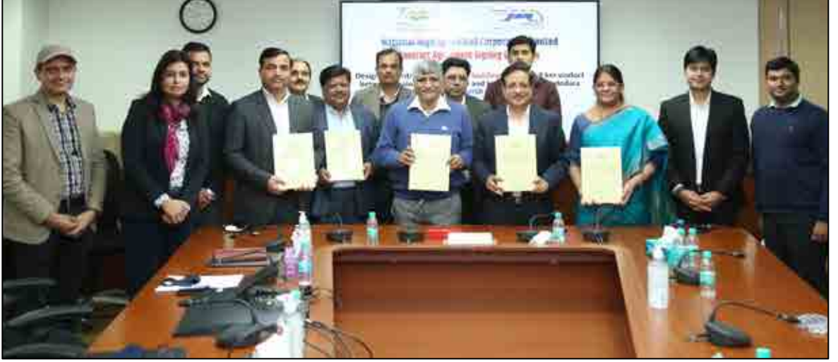
L&T લિમિટેડ સાથે C-5 કોન્ટ્રાક્ટ પેકેજ પર હસ્તાક્ષર

૩૧મી માર્ચ ૨૦૨૨ ના રોજ આપવામાં આવેલ ટેન્ડરની એકંદર / ક્યૂમ્યલટિવ સ્થિતિ, મૂલ્યાંકન હેઠળ, નોટિસ ઇન્વાઇટેડ ટેન્ડર (NIT) જારી / જારી કરવામાં આવશે વગેરે વિગતો નીચે આપેલ છે: