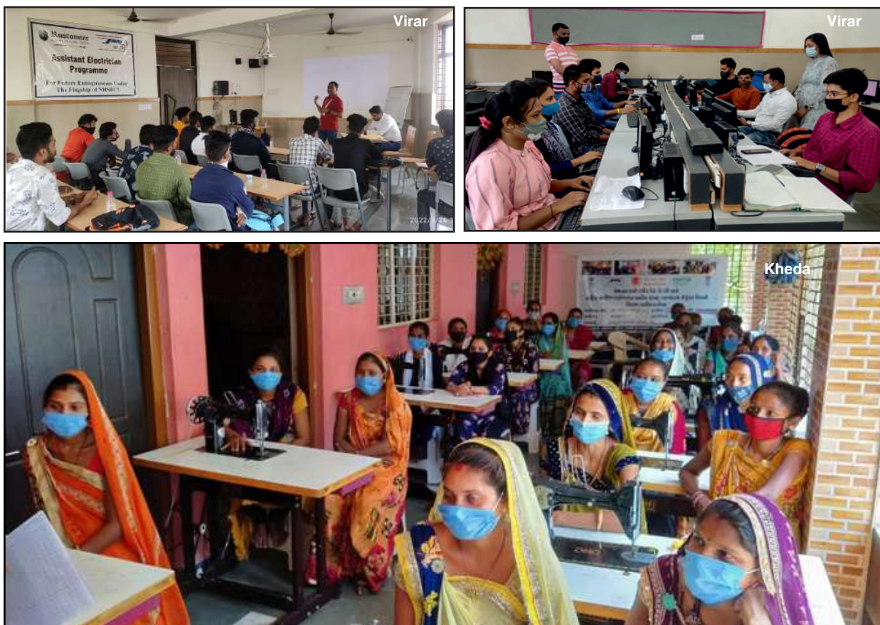
Various training courses organised under IRP at Gujarat

For Skill Enhancement Training, about seven institutes in Gujarat and four institutes in Maharashtra have been shortlisted. Till 31 st March 2022, about 703 PAPs were registered under different training programs {out of 2153 PAPs who have shown willingness for training under IRP}.