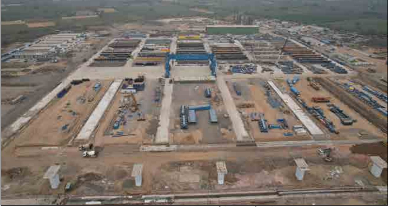
વડોદરા, ગુજરાત ખાતે કાસ્ટિંગ યાર્ડ વિકાસ કાર્ય પ્રગતિમાં છે

RTI પ્રશ્નો સામાન્ય રીતે જમીન સંપાદન, DPR, ભરતી, HSR પ્રોજેક્ટ વિશેની અન્ય સામાન્ય માહિતી વગેરે સંબંધિત હોય છે અને સામાન્ય રીતે નિયત સમયની અંદર જવાબ આપવામાં આવે છે. આ વર્ષ દરમિયાન, તમામ પ્રાપ્ત 124 અરજીઓ (11 પ્રથમ અપીલ અરજીઓ સહિત)નો નિકાલ કરવામાં આવ્યો છે.