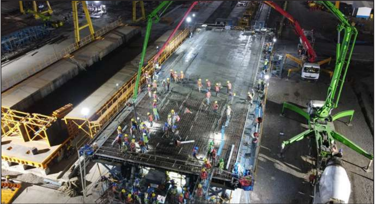
Full Span girder casting in progress, Anand, Gujarat