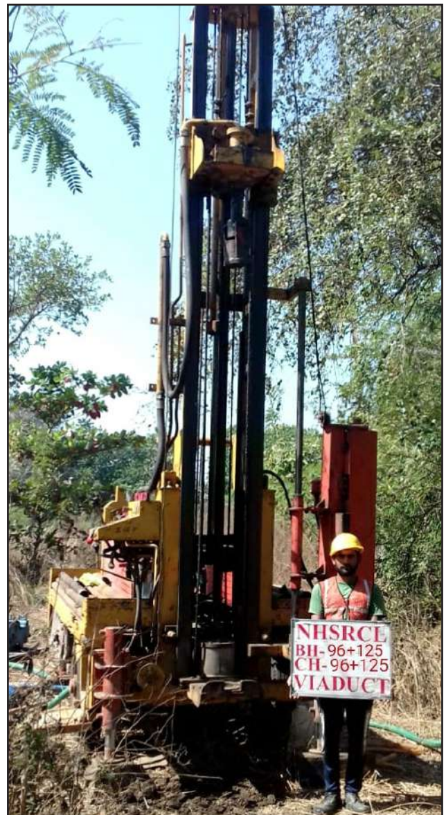
Geo-Technical works, Palghar, Maharashtra