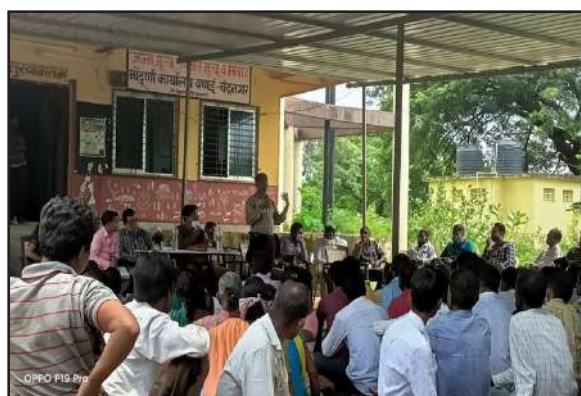
PESA Gram Sabha Meeting, Palghar, Maharashtra