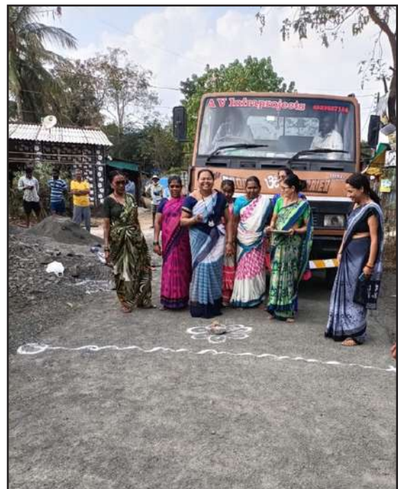
Newly Constructed Connecting Road, Virathan Khurd, Maharashtra