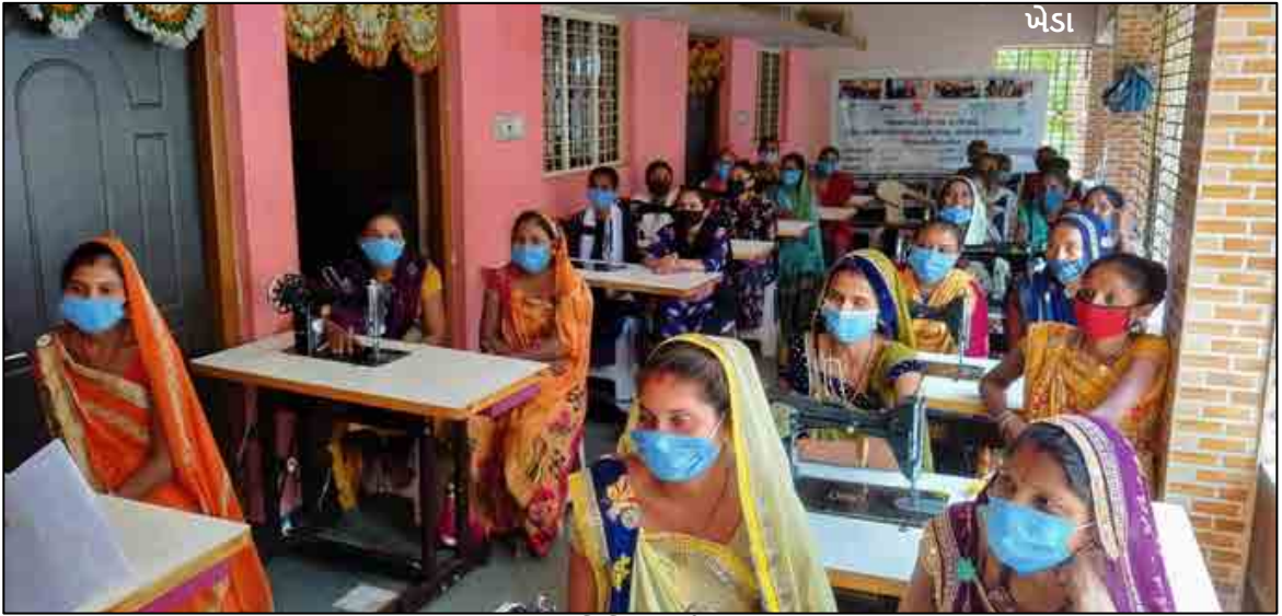
ગુજરાત ખાતે IRP હેઠળ વિવિધ તાલીમ અભ્યાસક્રમોનું આયોજન

2021-22 દરમિયાન, 1028 પ્લોટ માટે R&R એવોર્ડ જાહેર કરવામાં આવ્યા છે [એટલે કે. ગુજરાત રાજ્યમાં 894 પ્લોટ અને દીવ-દમણ અને દાદરા નાગર હવેલી જેવા કેન્દ્રશાસિત પ્રદેશમાં 134 પ્લોટ માટે]. આ સાથે, 31મી માર્ચ 2022 સુધી જાહેર કરાયેલ સંયિત આર એન્ડ આર એવોર્ડ 6143 પ્લોટ માટે છે [એટલે કે. ગુજરાત રાજ્યમાં 6009 પ્લોટ અને દીવ-દમણ અને દાદરા નાગર હવેલી જેવા કેન્દ્રશાસિત પ્રદેશમાં 134 પ્લોટ].