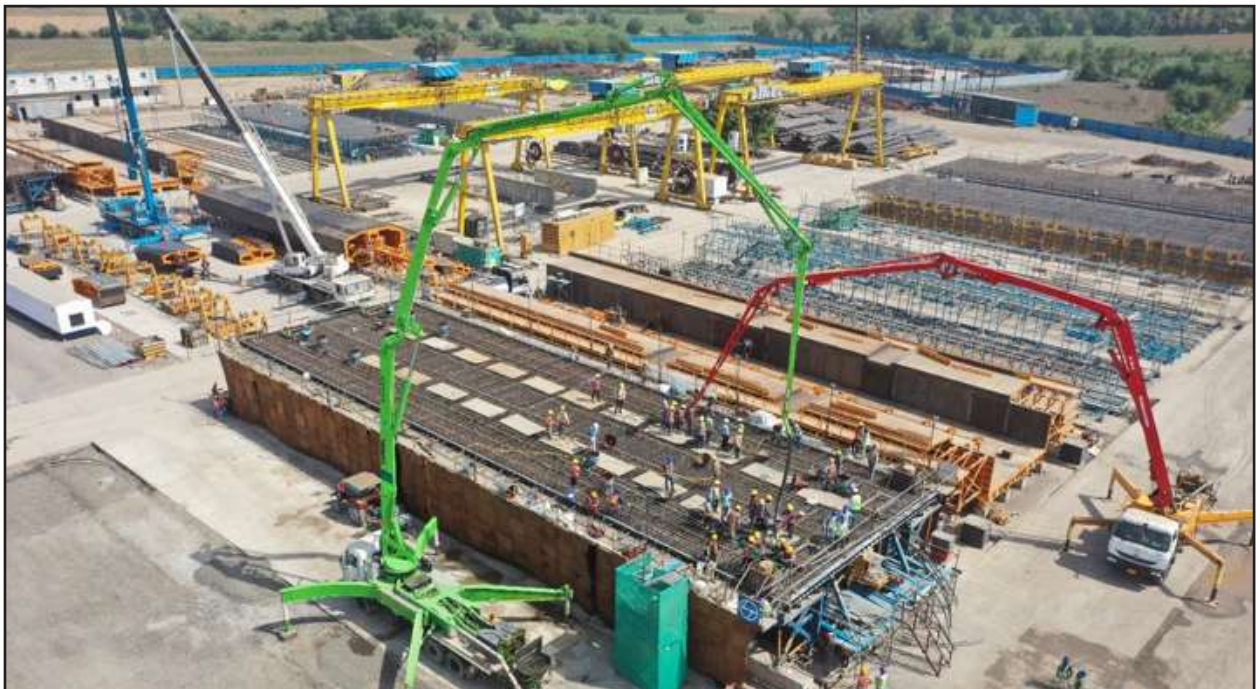
Full Span segment casting in progress, Anand, Gujarat

In addition, Full Span Girders and Segmental box girders are being cast in several state-of-the-art casting yards that have been established along the alignment.