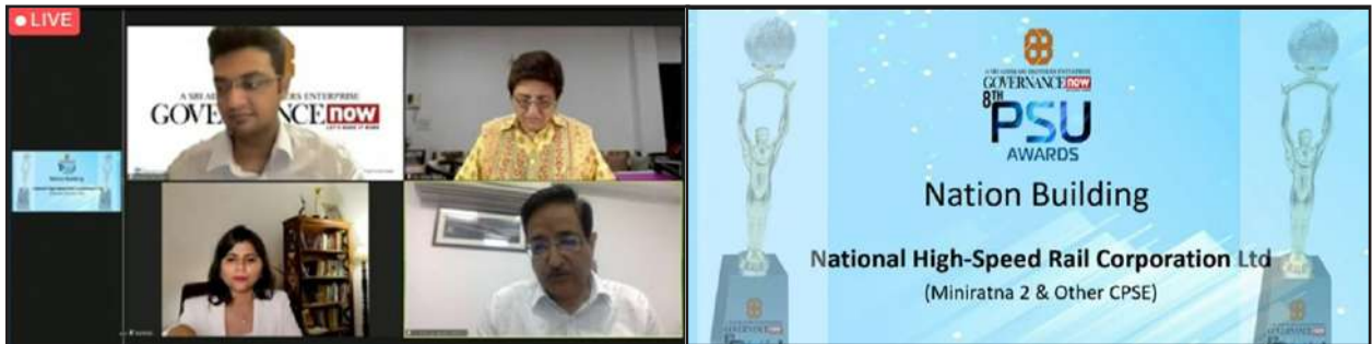
8th PSU Award 2021