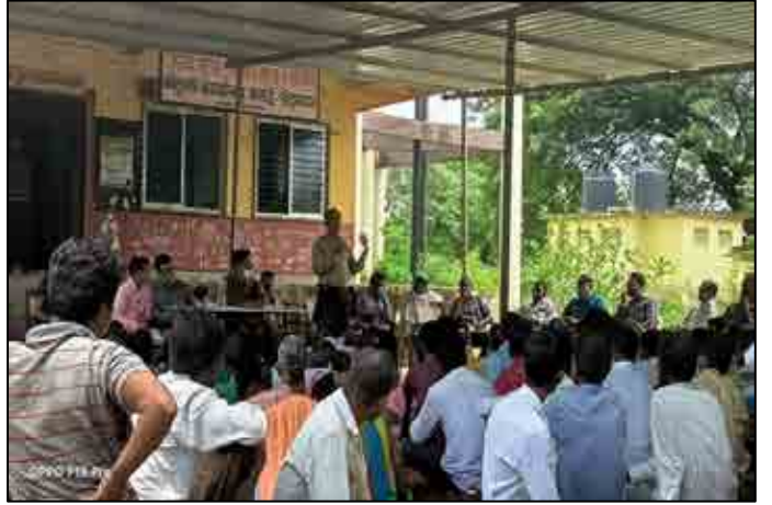
PESA ગ્રામ સભા સભા, પાલધર, મહારાષ્ટ્ર

ii) 31મી માર્ચ 2022 સુધીમાં ખાનગી જમીન માટે વળતર પેટે રૂ 8197.74 કરોડનું વિતરણ કરવામાં આવ્યું છે [ગુજરાતમાં અને દીવ-દમણ અનેદાદરા નગર હવેલીમાં: રૂ. 5913.47 કરોડ અને મહારાષ્ટ્રમાં: રૂ. 2284.27 કરોડ].