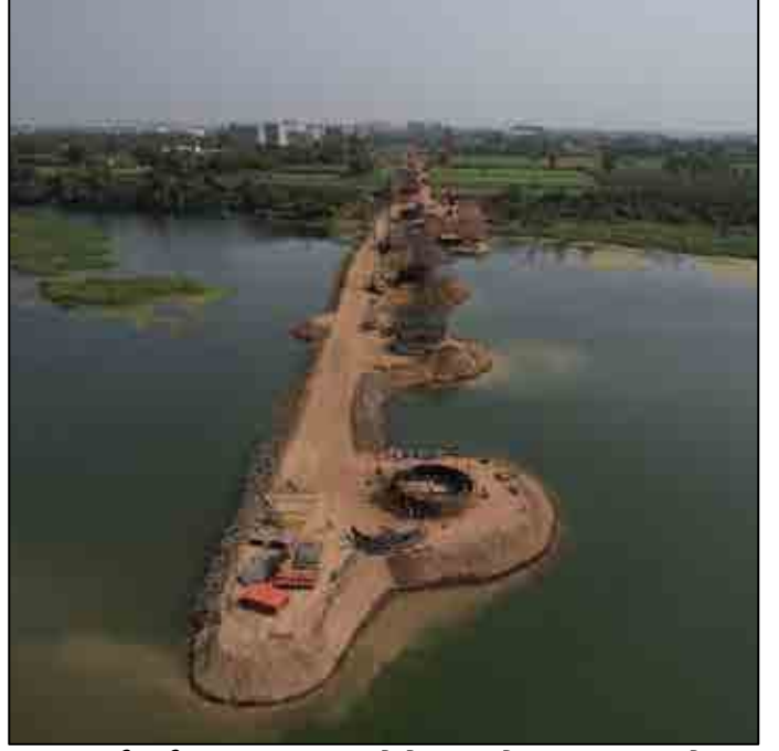
તાપ્તી નદી, સુરત, ગુજરાત ખાતે વેલ-ફાઉન્ડેશનનું કામ ચાલુ છે

સાબરમતી નદી પરના પુલ પર GTA પ્રક્રિયા ચાલી રહી છે. અન્ય ત્રણ મુખ્ય નદીઓ (જેમ કે નર્મદા, તાપ્તી અને મહી) પર પુલનું બાંધકામ શરૂ થઈ ગયું છે. 31મી માર્ચ 2022 સુધીમાં, નર્મદા બ્રિજ પર 11 વેલ ફાઉન્ડેશન (22માંથી), માહી બ્રિજ પરના તમામ 12 વેલ ફાઉન્ડેશન અને તાપ્તી બ્રિજ પર 6 વેલ ફાઉન્ડેશનનું બાંધકામ હાલમાં ચાલુ છે.