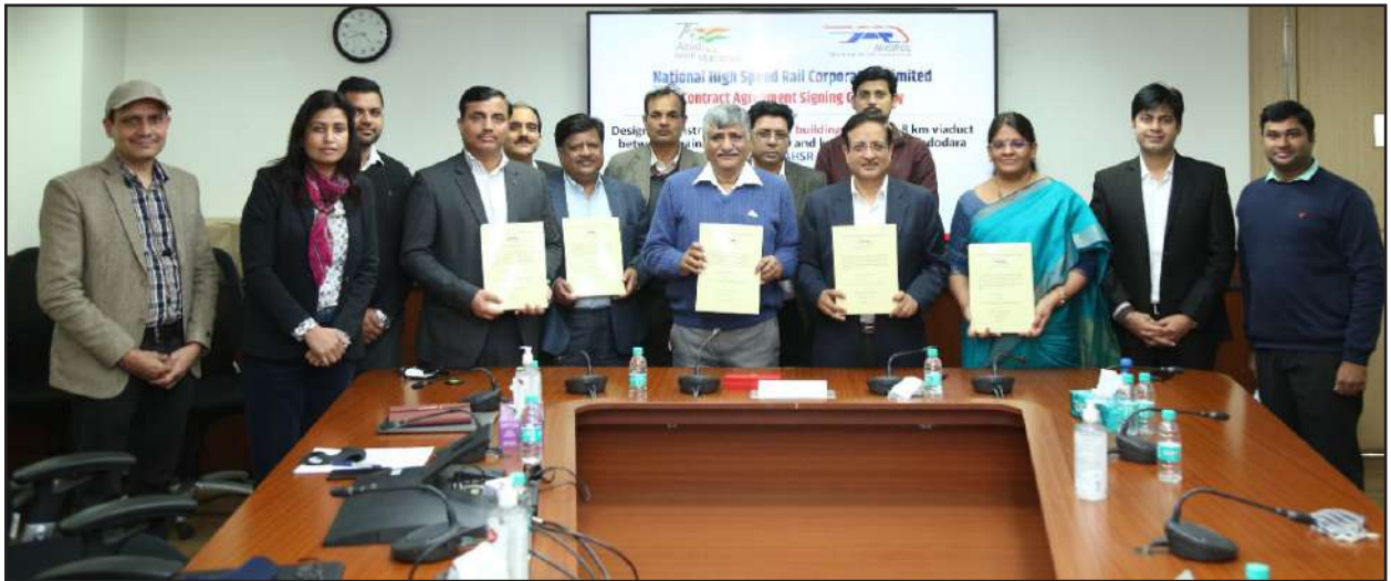
Signing of C-5 contract package with L&T Limited

The overall / cumulative status of tender awarded, under evaluation, Notice Inviting Tender (NIT) issued / to be issued, etc., as on 31st March 2022, is given below: