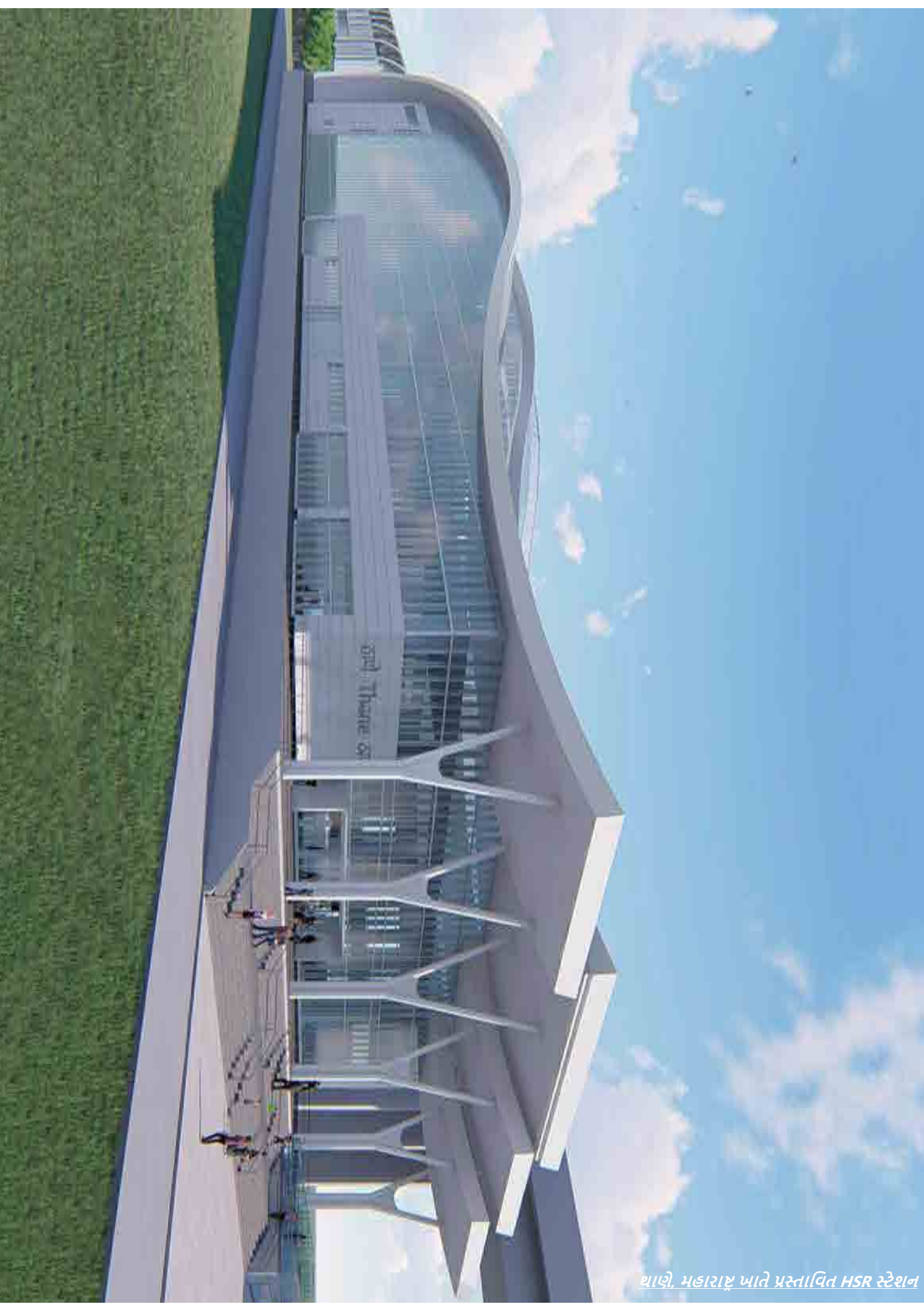
थाणे, महाराष्ट्र ખાતે પ્રસ્તાવિત HSR સ્ટેશન