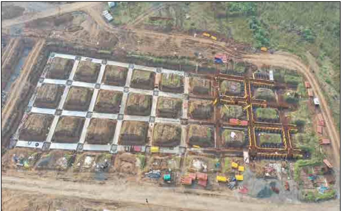
HSR સુરત સ્ટેશન, ગુજરાત ખાતે સૂચિત પાઇલ હેડ વર્કસ

પાંચ HSR સ્ટેશનો પર બાંધકામ [વાપી, બિલીમોરા, સુરત, ભરૂચ અને આણંદ] (8 માંથી) વર્ષ 2021-22 દરમિયાન શરૂ થયા છે.