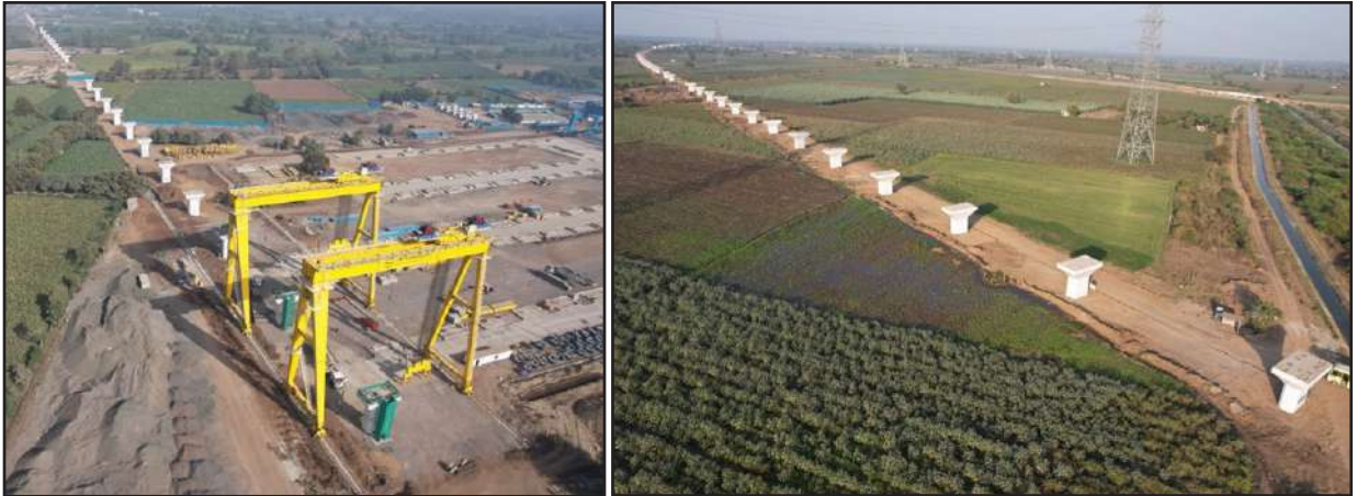
Completion of Pier & Pier cap works, Gujarat

In addition, Full Span Girders and Segmental box girders are being cast in several state-of-the-art casting yards that have been established along the alignment.