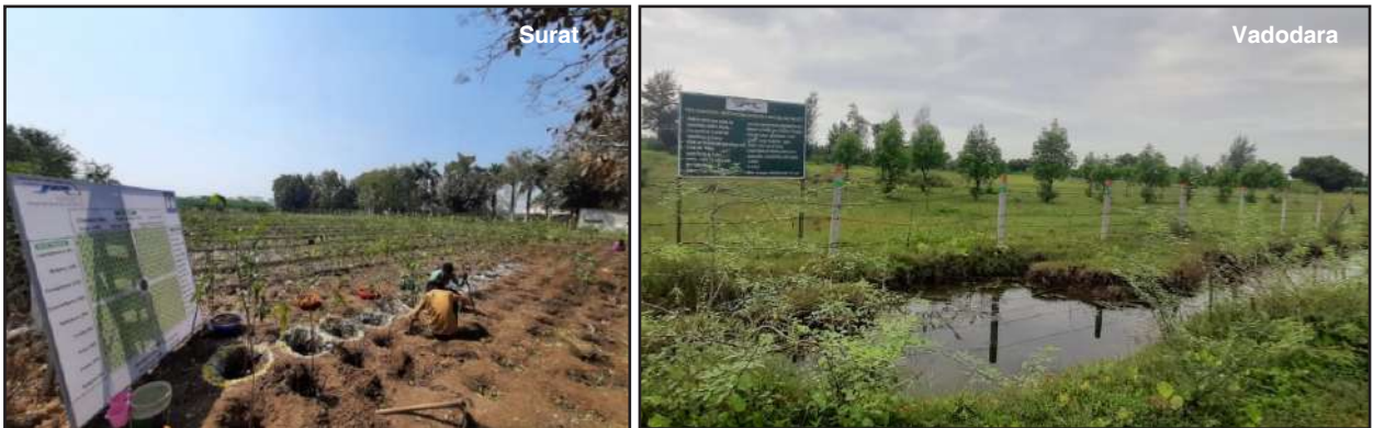
Plantation Works, Gujarat

Till 31 st March 2022, the Company has transplanted 7,896 trees, and additional 77,775 trees have been planted on account of compensatory plantation at different locations.