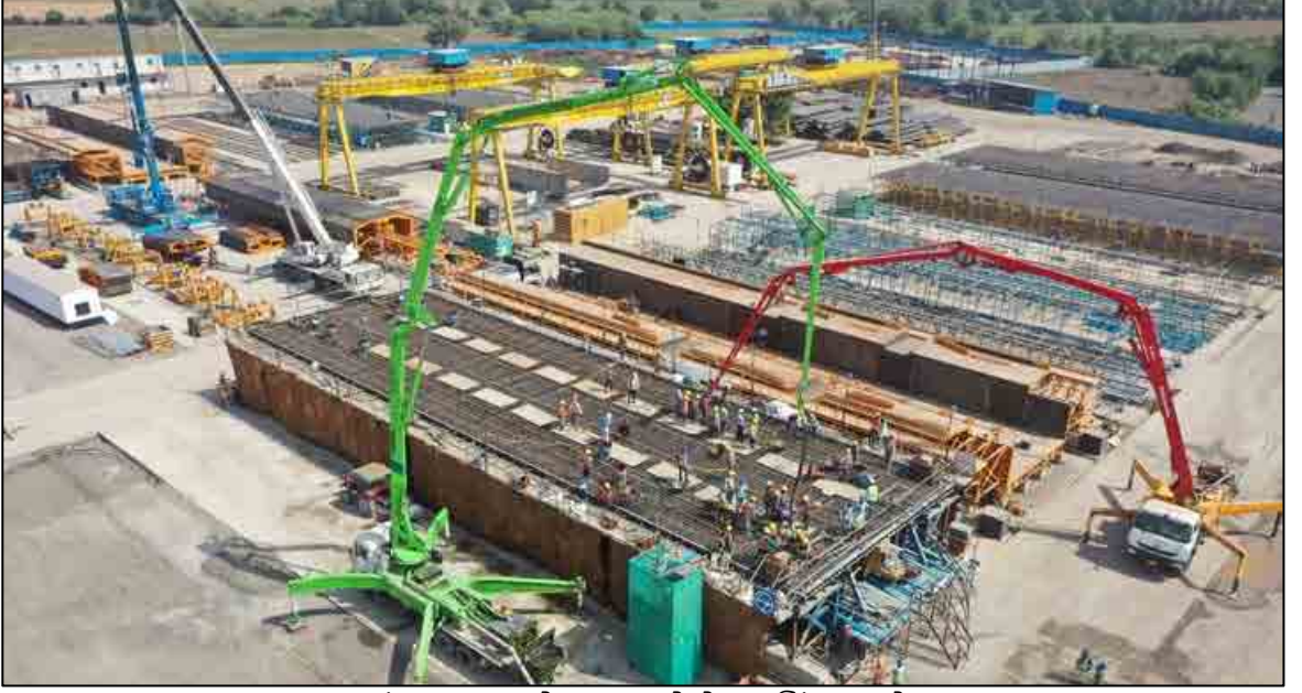
આણંદ, ગુજરાત ખાતે કુલ સ્પાન સેગમેન્ટ કાસ્ટિંગ યાર્ડ છે

આ ઉપરાંત, કુલ સ્પાન ગર્ડર્સ અને સેગમેન્ટલ બોક્સ ગર્ડર્સ ઘણા અત્યાધુનિક કાસ્ટિંગ યાર્ડ્સમાં નાખવામાં આવે છે જે અલાઈમેન્ટ સાથે સ્થાપિત કરવામાં આવ્યા છે.