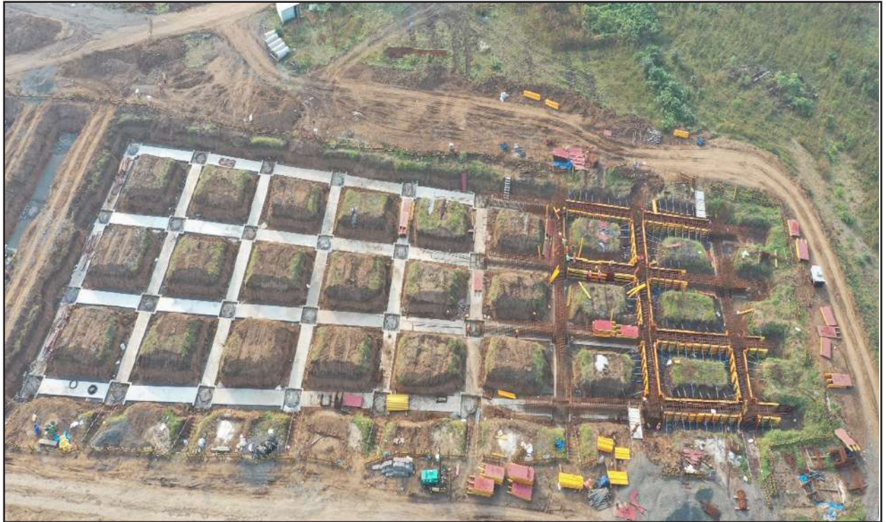
Pile Head works proposed HSR Surat Station, Gujarat