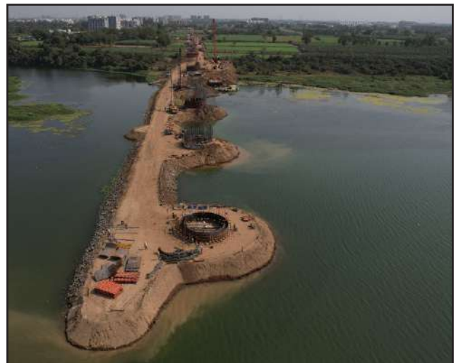
Well foundation work in progress at Tapi River, Surat, Gujarat

GTI is in process at bridge over Sabarmati River. Bridge construction has started on the other three major rivers (viz. Narmada, Tapi, and Mahi). As on 31 st March 2022, construction is in progress on 11 well foundations (out of 22) at the Narmada Bridge, all 12 well foundations at the Mahi Bridge, and 6 well foundations at the Tapi Bridge.