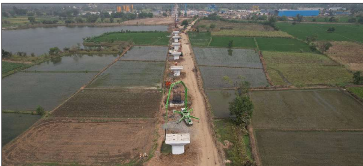
Pier work in progress, Billimora, Gujarat

On 330 kms (out of 352 kms), comprehensive Geotechnical Investigation (GTI) work (100m interval) has been conducted. Based on the said detailed GTI, Good for Construction drawings have been prepared for a length of 165 km.