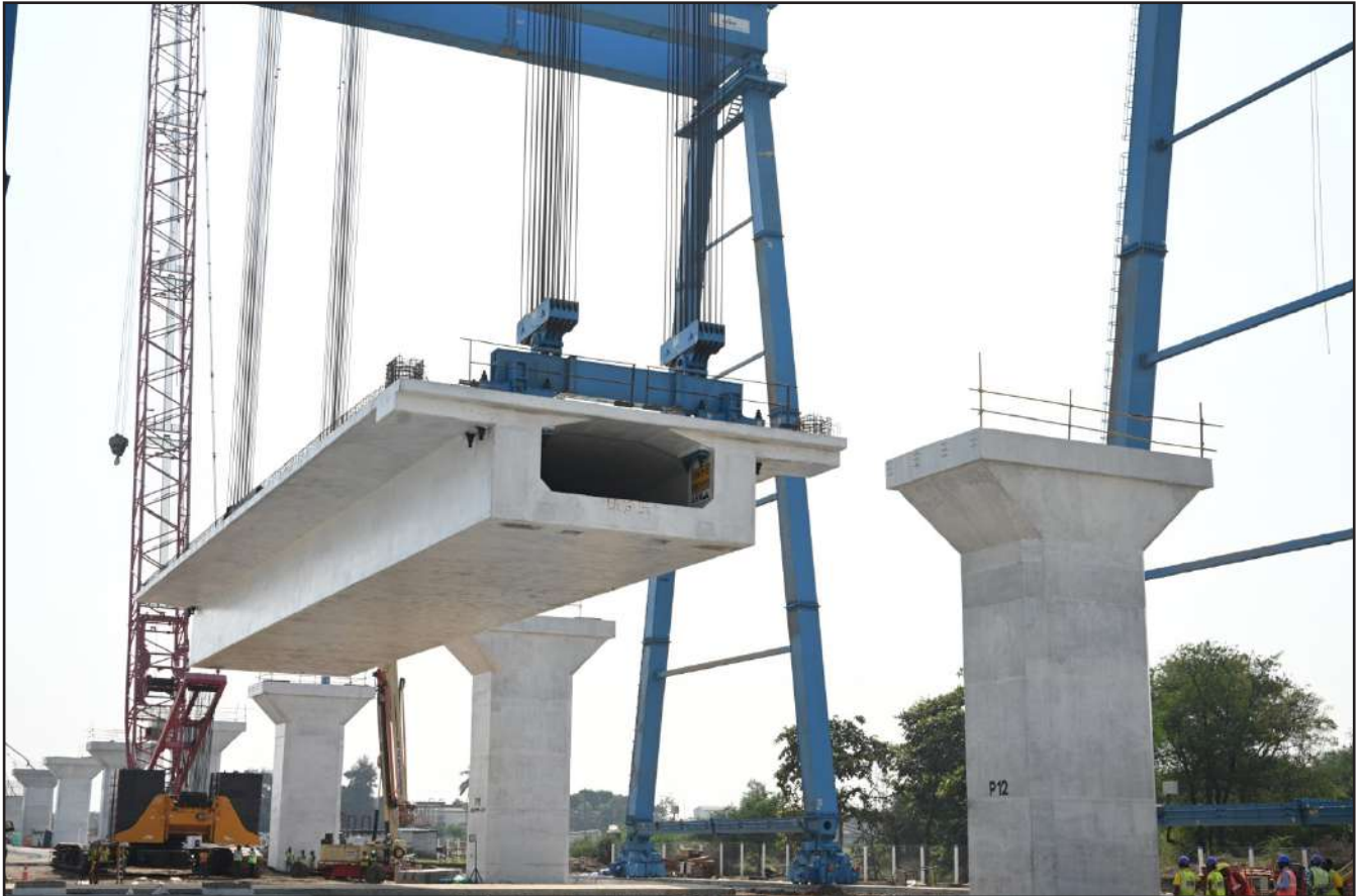
Launching of 40m full span girder, Gujarat