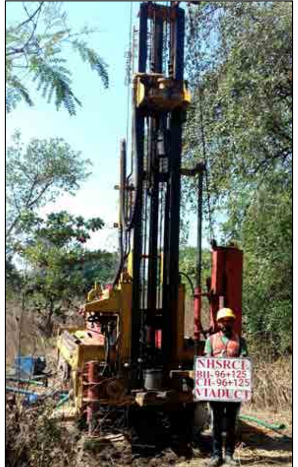
પાલધર, મહારાષ્ટ્ર ખાતે જીઓ-ટેક્નિકલ વર્ક્સ