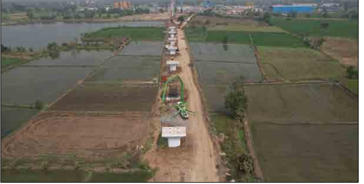
બિલીમોરા, ગુજરાત ખાતે પિયરનું કામ ચાલુ છે

330 કિલોમીટર (352 કિલોમીટરમાંથી) જેટલા માર્ગ પર વ્યાપક રીતે જીઓટેકનિકલ ઇન્વેસ્ટિગેશન (GTI) કાર્ય (100m અંતરાલ) હાથ ધરવામાં આવ્યું છે. ઉપરોક્ત વિગતવાર GTI ના આધારે, 165 કિમીની લંબાઈ માટે ગુડ ફોર કન્સ્ટ્રક્શન ડ્રાઈઇંગ તૈયાર કરવામાં આવ્યા છે.