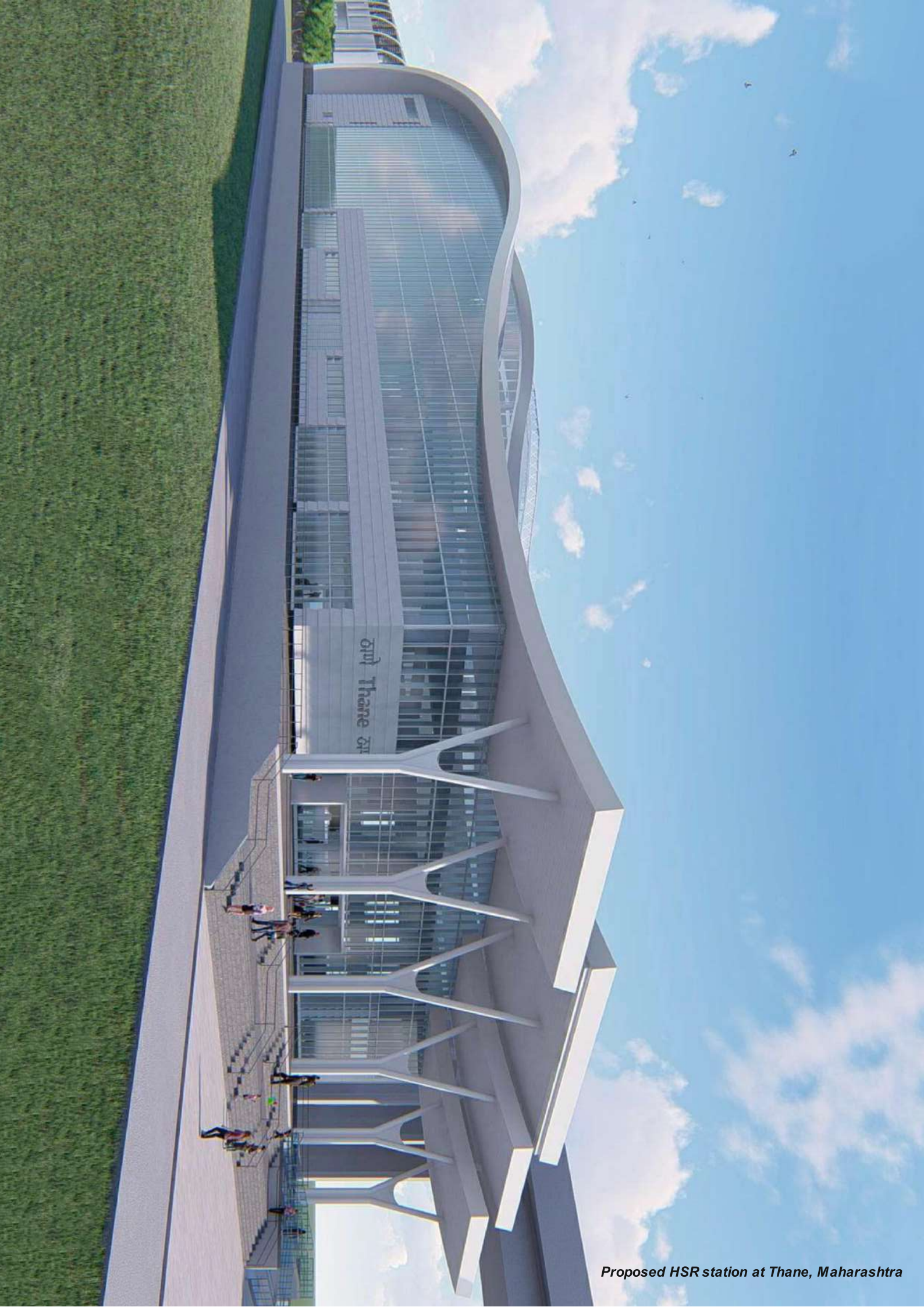
Proposed HSR station at Thane, Maharashtra