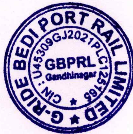
Additional Chief Secretary